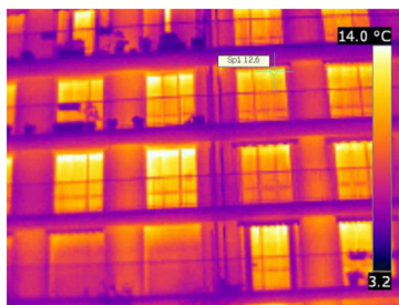
Thermographie d'une des façades de la copropriété