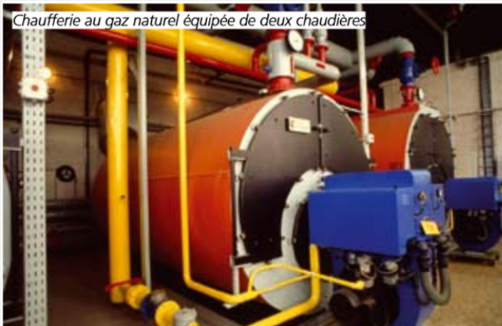
Chaufferie au gaz naturel équipée de deux chaudières