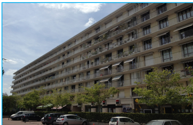
Vue générale juin 2015

Cette copropriété importante de 150 logements construite en 1969 est engagée dans une démarche de rénovation énergétique depuis 2011. Grâce à un conseil syndical investi et ayant axé le projet sur l'information et la concertation avec les copropriétaires, le remplacement des menuiseries a pu être voté par l'intermédiaire d'un achat groupé et les chaudières remplacées par deux chaudières à condensation.