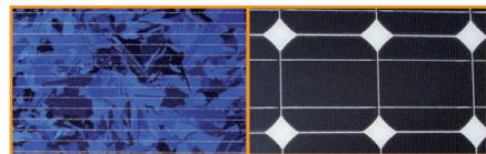
Silicium polycristallin, à gauche, et monocristallin, à droite